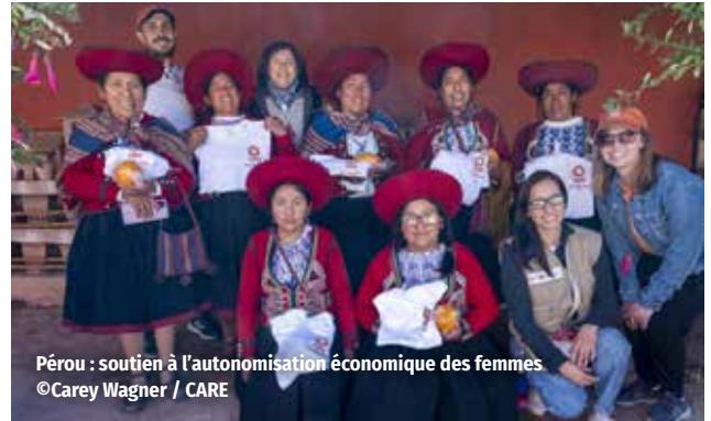
Pérou : soutien à l'autonomisation économique des femmes