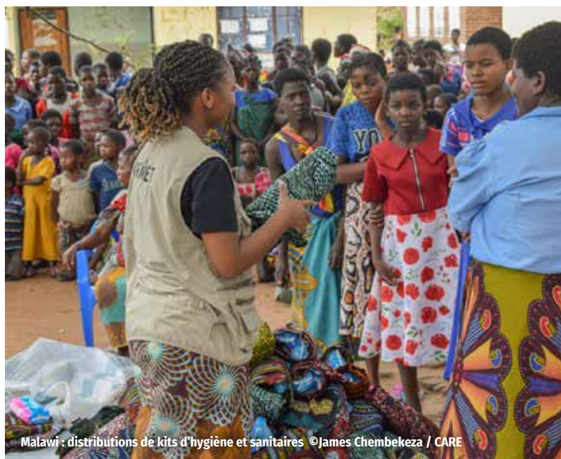
Malawi - distributions de kits d'hygiène et sanitaires

L'investissement en recherche de fonds est en légère baisse et se situe à 5,0M €. Il représente 7 % des charges. Conformément aux objectifs de croissance des dons individuels, l'association continue d'investir principalement dans le recrutement de donateurs dans la rue et sur le digital. Les frais de communication et de fonctionnement représentent 3,2 % des charges. Ils incluent la contribution de CARE France au Secrétariat de CARE International. L'exercice précédent comptait des fonds liés à la réponse ukrainienne utilisés cette année. Un résultat de 91K € est généré sur l'exercice.