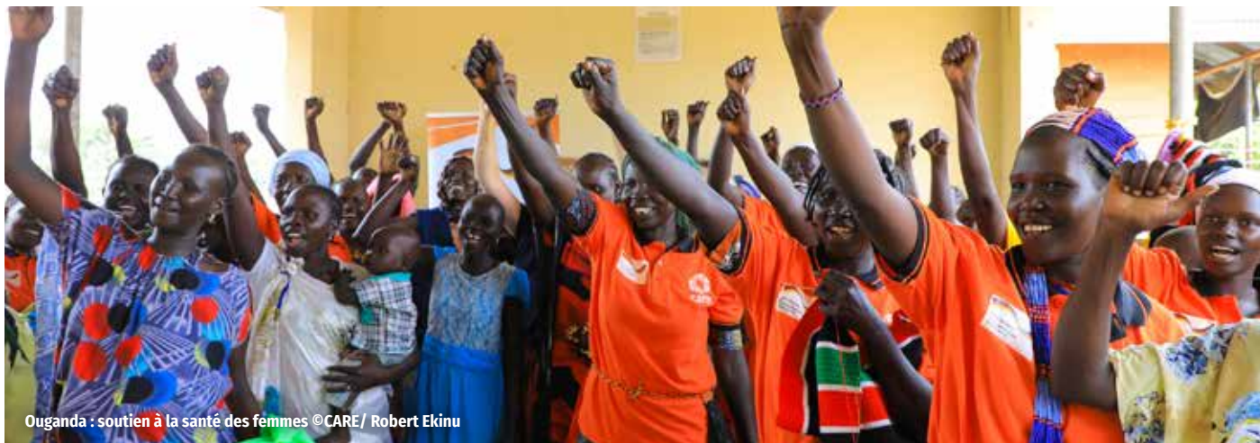
Ouganda : soutien à la santé des femmes