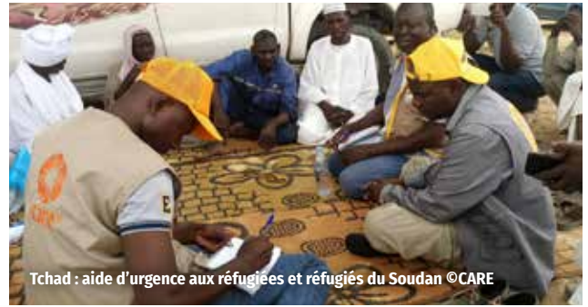
Tchad : aide d'urgence aux réfugiées et réfugiés du Soudan

De nombreuses mesures d'amélioration des process et des contrôles sont actuellement mises en place et permettront que la production des comptes du prochain exercice respecte les délais.