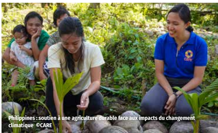
Philippines : soutien à une agriculture durable face aux impacts du changement climatique

Dans un contexte marqué par la violence sexiste, CARE mène plusieurs actions : formations contre les violences de genre, soutien psychosocial, distribution de kits de dignité et aide financière visant à réduire les inégalités et vulnérabilités.