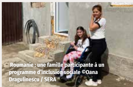
Roumanie : une famille participante à un programme d'inclusion sociale