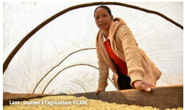
Laos : soutien à l'agriculture