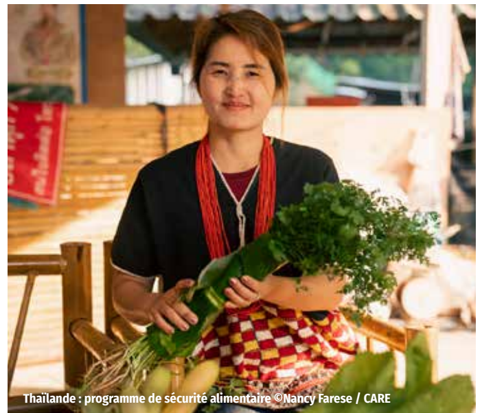
Thaïlande : programme de sécurité alimentaire

La participation des communautés dans l'élaboration et la mise en œuvre de nos actions est primordiale pour en assurer la pérennité. C'est aussi la raison pour laquelle CARE emploie des équipes locales qualifiées et collabore avec des associations locales.