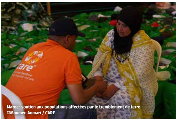
Maroc : soutien aux populations affectées par le tremblement de terre

Les femmes sont les plus exposées à la pauvreté et aux discriminations. Or, les sociétés ne pourront pas se développer durablement tant que la moitié de leur population n'aura pas les mêmes droits. Pour promouvoir les droits des femmes, CARE et cinq partenaires soutiennent financièrement des petites organisations féministes et appuient leurs capacités techniques ainsi que leurs actions de plaidoyer. Axé sur des enjeux majeurs comme la lutte contre les violences de genre et l'émancipation économique, ce soutien a aussi stimulé la création de réseaux féministes. Par exemple, « Feministas en acción » en Amérique latine promeut désormais les droits sexuels à l'ONU, avec une approche intersectionnelle.