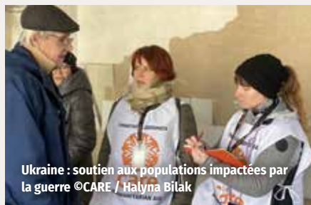
Ukraine : soutien aux populations impactées par la guerre