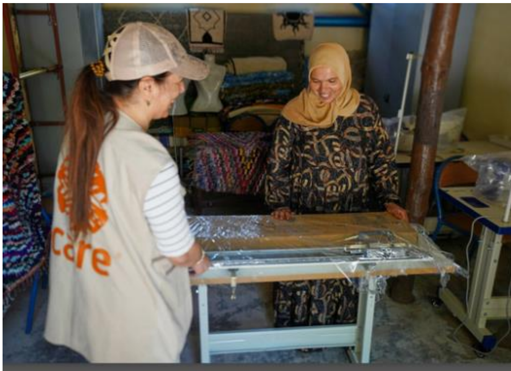
Maroc : soutien au développement économique des femmes.

voix de CARE, ainsi que celle des femmes et des filles en situation d'urgence, devant la ministre des Affaires étrangères.