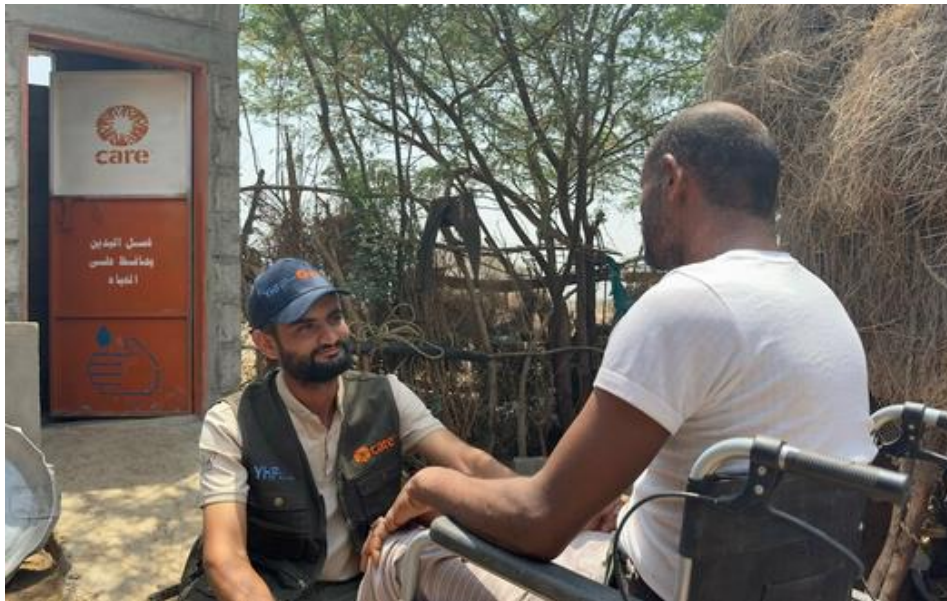
Yémen : accès à l'assainissement.