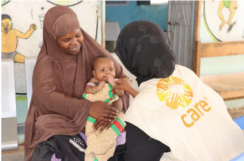
Somalie : accès à la santé pour les enfants malnutris.

CARE France est une association selon la loi de 1901, reconnue d'utilité publique.