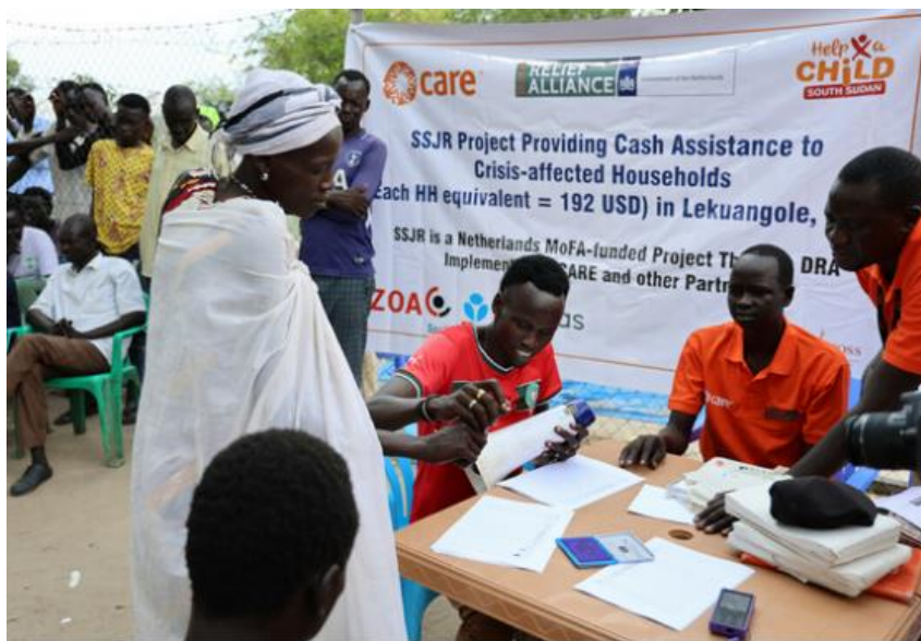
Soudan : soutien aux populations touchées par la sécheresse.