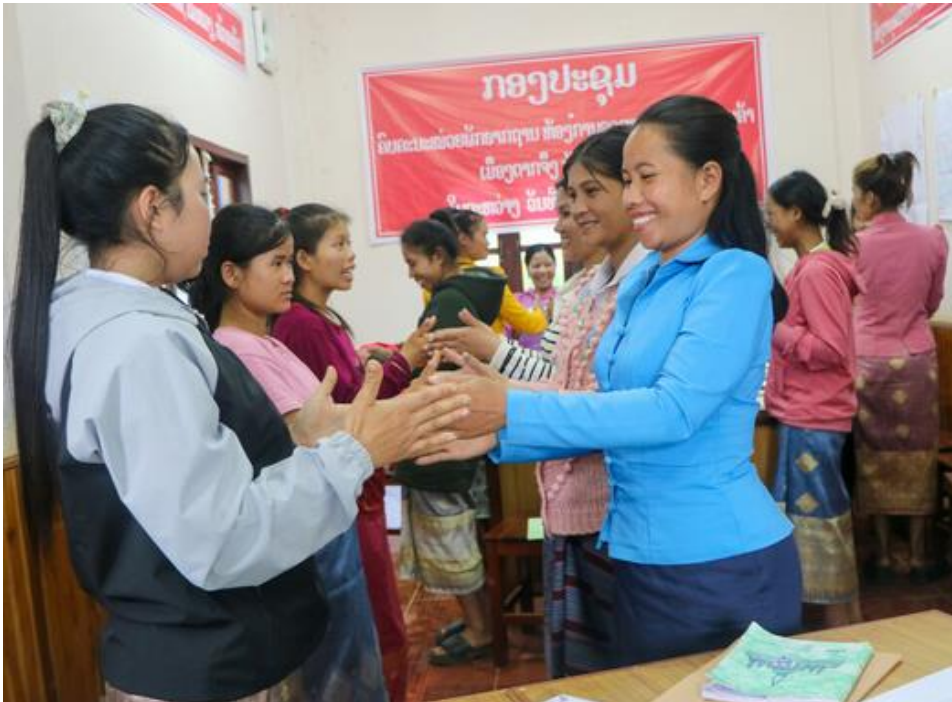
Laos : renforcement du leadership des femmes issues de minorités ethniques.

Le réseau CARE défend les droits des femmes et des filles et les accompagne pour sortir de la pauvreté.