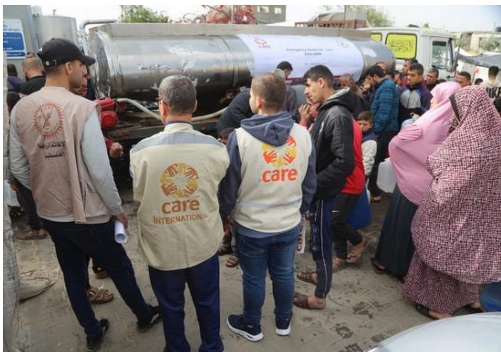
Gaza : aide d'urgence aux personnes touchées par la guerre.

De la préparation à la réhabilitation, le réseau CARE soutient les populations victimes des crises humanitaires.