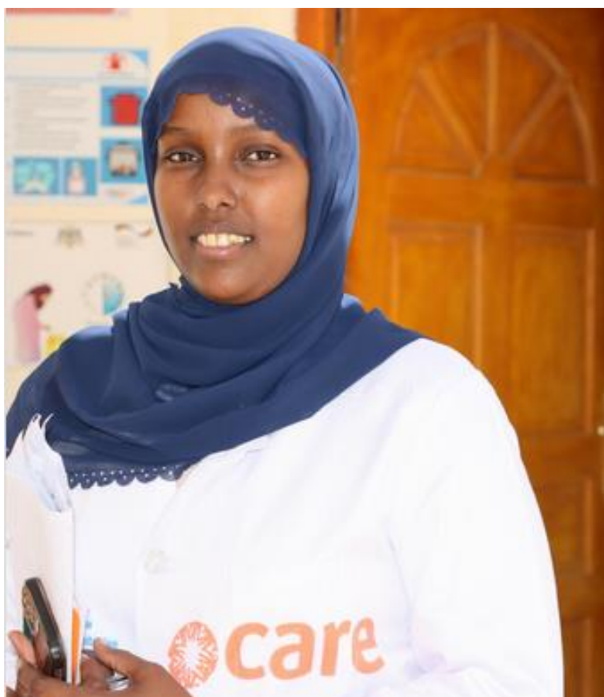
Somalie : accès aux soins des personnes réfugié.e.s et déplacé.e.s