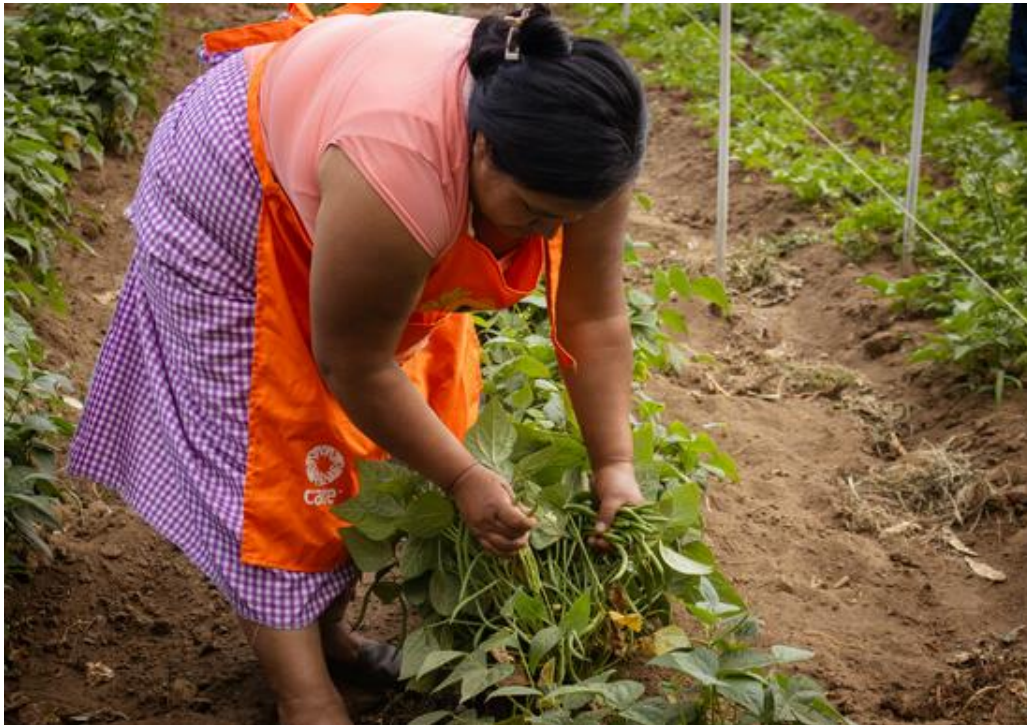
Guatemala : soutien à l'agriculture.

Le réseau CARE aide les populations à se protéger des aléas climatiques et mieux s'adapter au changement climatique.