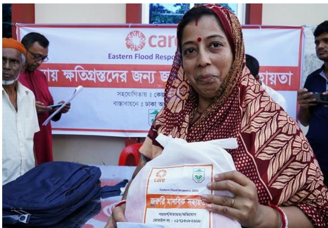
Bangladesh : aide d'urgence aux populations touchées par les catastrophes naturelles.