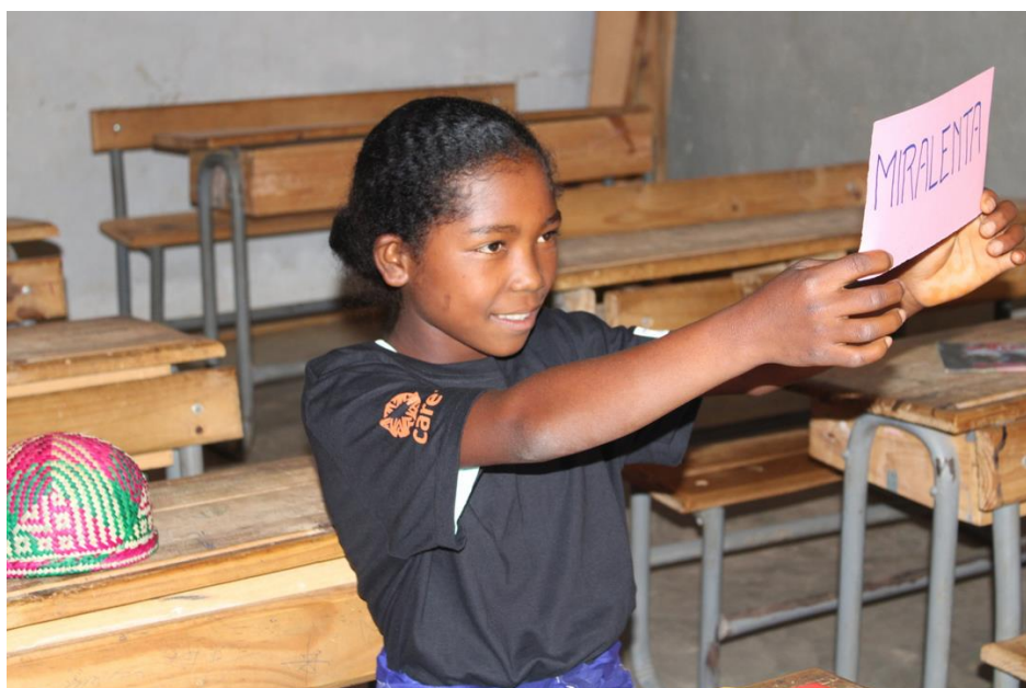
Madagascar : sensibilisation dans les écoles sur les droits des femmes et des filles .

CARE France et 13 entreprises ont rédigé une lettre de recommandations pour mieux intégrer la lutte contre les violences conjugales et sur le lieu de travail. Ce document propose des actions concrètes, telles que des congés payés, la protection contre le licenciement et la flexibilité horaire. Le 14 décembre 2023, cette lettre a été remise à la ministre de l'Égalité, Bérangère Couillard, lors d'un événement de plaidoyer de haut niveau.