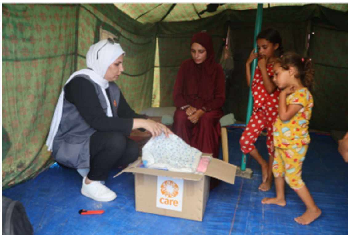
Gaza : aide d'urgence aux personnes touchées par la guerre

À l'Est du Tchad, les réfugié-es du conflit soudanais font face à une grande précarité et de graves violences. CARE et son partenaire les soutiennent en renforçant la prévention et la réponse aux violences faites aux femmes : prise en charge des victimes dans des espaces sûrs, formation d'agent.es de santé, sensibilisation et prévention.