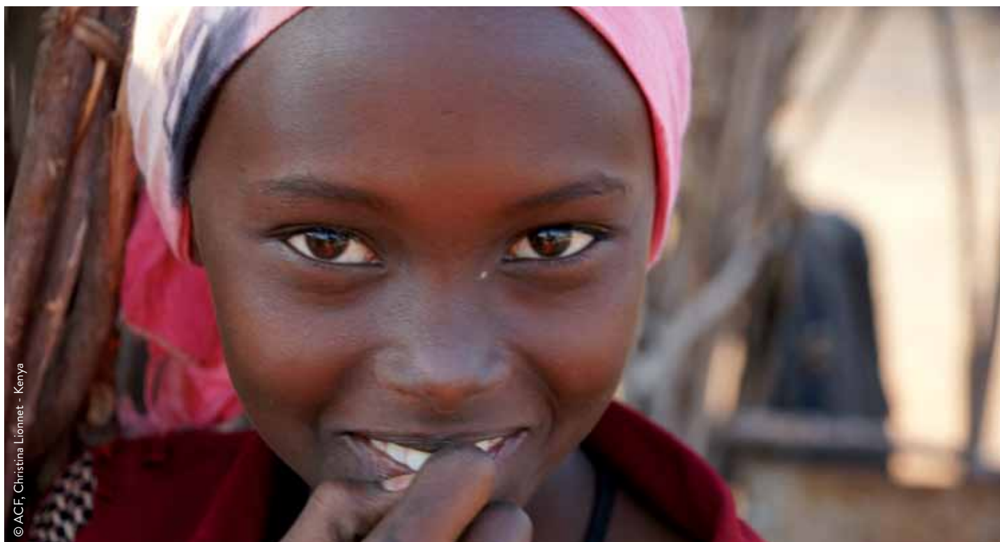
© ACF, Christina Lionnet - Kenya